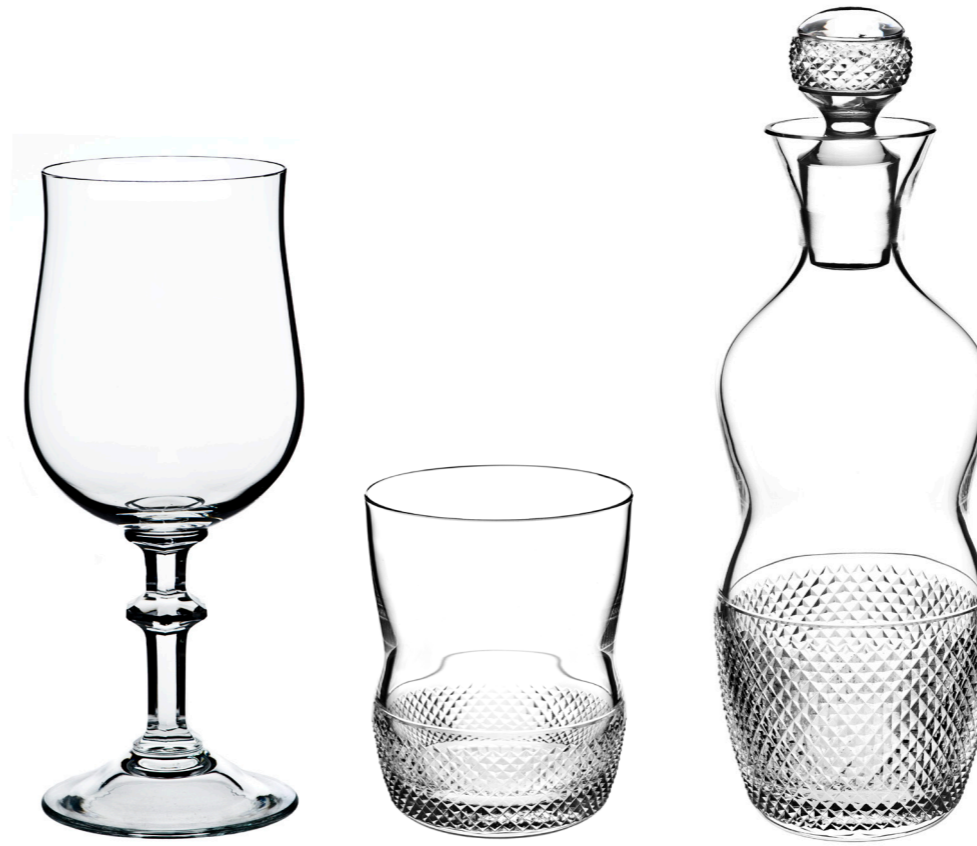
Weinglas 202 mm