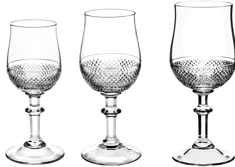
Degustierglas 173 mm

2010 Gottfried Palatin's SAMIRA series was introduced the first time. Ever since, the artist and product designer of Vienna, Austria added various sizes and shapes, forming one of the most comfortable and sophisticated series for exquisite table settings. SAMIRA supplies the suitable glass for plenty occasions and functions. Pleasantly handy and surprisingly stable, SAMIRA enriches the most exquisite dinner party as well as the lunches and suppers in the normal course of a splendid life. The SAMIRA glasses are (hand-)made plain or with the elegant pineapple cut.