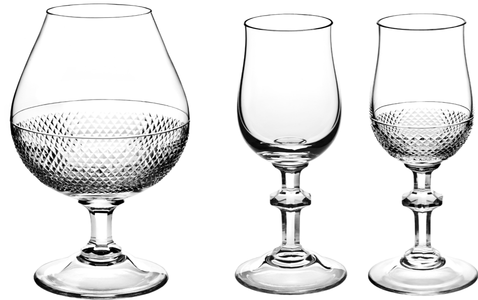
Cognacschwenker 168 mm

Die Weinglasserie des Wiener Designers und Künstlers Gottfried Palatin wurde 2010 erstmals vorgestellt und seither mehrmals erweitert. In ihrer großen Vielfalt an Größen und Formen hat sie das, was man von einem klassischen Tafelservice erwartet: für alle Erfordernisse der eleganten Tafel und darum herum ein passendes Glas. Für seine Funktion optimiert ist es gleichzeitig so robust und handlich, dass es den Alltag wie den Festtag aufs angenehmste bereichert. Die Gläser gibt es mit glattem Kelch und mit klassischem Diamantschliff.