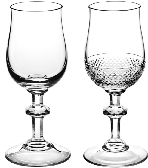
Portweinglas 161 mm